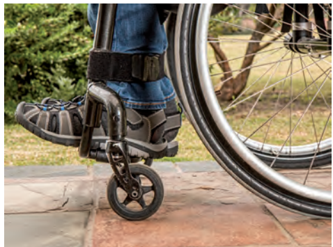
Bundesteilhabegesetz soll Situation von Menschen mit Behinderungen verbessern

Das Gesetz zur Stärkung der Teilhabe und Selbstbestimmung von Menschen mit Behinderungen (Bundesteilhabegesetz – BTHG) ist eine der größten sozialpolitischen Reformen der letzten Jahre. Es tritt in mehreren Stufen in Kraft, der größte und letzte Teil wird zum 1.1.2020 in Kraft treten. Die Eingliederungshilfe wird gesetzlich neu verankert. Damit sind Verbesserungen der Einkommens- und Vermögenssituation der Betroffenen verbunden. Weiterhin sollen die Rehabilitation gestärkt, die Zusammenarbeit von Trägern unterschiedlicher Leistungen verbessert und berufliche Alternativen zu den Werkstätten für behinderte