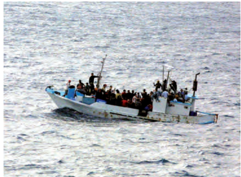
Weniger Schutz suchende Menschen kamen nach Deutschland

nen Asylverfahren beim BAMF abgebaut werden konnte, gleichwohl die Asylverfahren immer noch zu lange dauern. Ein Umstand, der vom Deutschen Städtetag in verschiedenen Gesprächsformaten gegenüber der Bundeskanzlerin, dem BAMF und dem BMI adressiert wurde. Daher unterstützt der Deutsche Städtetag die Ankündigung des Bundes, die Asylverfahren effizienter zu gestalten. Zum einen müssen die nach Deutschland geflüchteten Menschen schnell Klarheit über ihren Status erlangen. Zum anderen ist für die Städte von großem Interesse, dass nur Menschen mit Bleibeperspektive auf die Städte verteilt werden. Dies vor allem, um sich auf die Integration der Menschen mit Bleibeperspektive konzentrieren zu können und die Integrationsfähigkeit der Städte zu erhalten. Begrüßt wurde daher die Ankündigung der Bundesregierung im Koalitionsvertrag, eine stärkere Steuerung von Migrationsbewegungen und Zuwanderung anzustreben. Der Deutsche Städtetag hat vor diesem Hintergrund auch eine Entfristung der Wohnsitzauflage befürwortet.