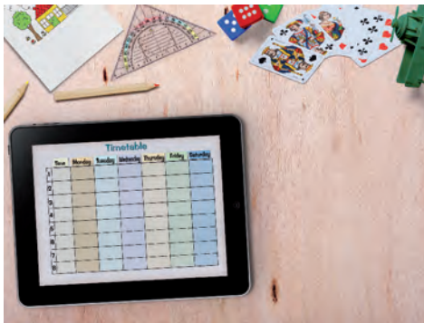
Digitalisierung an Schulen ist große Herausforderung

Der Ausbau der Digitalisierung in der Bildung stellt die Städte als Schul- und Bildungsträger vor erhebliche finanzielle und organisatorische Herausforderungen. Der Ausbau der digitalen Bildung in den Schulen ist eine Aufgabe von gesamtgesellschaftlicher Bedeutung, die nur im gesamtstaatlichen Zusammenwirken aller Akteure gelingen kann. Der Deutsche Städtetag hat daher gefordert, dass Bund und Länder und Beteiligung der kommunalen Spitzenverbände sowie Unternehmen eine Gesamtstrategie im Sinne eines Masterplans entwickeln. Sowohl auf der Bundesebene wie auch in den Ländern gibt es Initiativen und Programme zum Ausbau digitaler Bildung. Aus kommunaler Sicht erscheint es notwendig, zumindest eine sinnvolle Verzahnung der unterschiedlichen Programme zu gewährleisten.