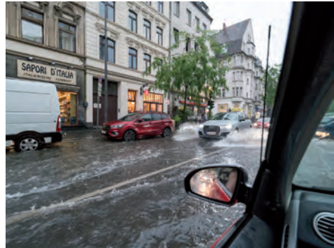
Katastrophenschutz soll nah bei den Betroffenen bleiben

für aufwendig zu beschaffende Spezialeinsatzmittel, wie z. B. Fluggeräte zur Brandbekämpfung, die nur in einigen wenigen Mitgliedsstaaten dauerhaft vorgehalten werden müssen. Verbessert werden sollten zudem in Abstimmung mit den Mitgliedsstaaten das EU-weite Meldeverfahren bei Katastrophenfällen und die Integration der in den Mitgliedstaaten vielfach vorhandenen Einsatzmittel in das Koordinierungsverfahren der EU.