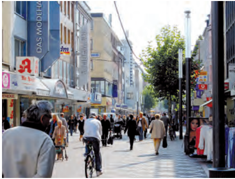
Einkaufsverhalten und Freizeitverhalten verändern sich

Der gesellschaftliche, soziale und demografische Wandel sowie der technologische Fortschritt verändern die Bedürfnisse, die Nachfrage und das Verhalten der Menschen – dies bleibt nicht ohne Auswirkungen auf Städte und Handel. Individualisierung und demografische Veränderungen wirken sich auf Kundenstruktur und Einkaufsverhalten aus. Der reine Konsum ist nicht mehr allein Auslöser für einen Besuch in der Innenstadt, vielmehr werden damit weitere Aktivitäten wie Freizeitgestaltung, Unterhaltung, sozialer Austausch und Kultur als Gesamterlebnis verbunden. Auf der Grundlage des Diskussionspapiers „Zukunft von Stadt und Handel“ hat der Deutsche Städtetag gemeinsam mit dem Handelsverband Deutschland (HDE) das Positionspapier „Zukunft für die Innenstadt“ für einen zukunftsfähigen Einzelhandel in lebendigen Innenstädten durch eine engere Zusammenarbeit von Stadt, Handel und Immobilieneigentümern vorgelegt.