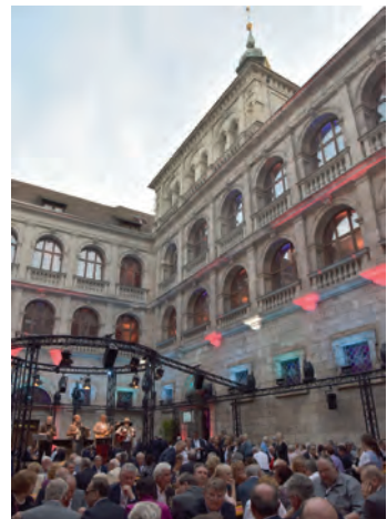
Abendempfang der Stadt im Nürnberger Rathaus

Im Programm der Hauptversammlung wurden erstmals elf Exkursionen innerhalb der gastgebenden Stadt Nürnberg zu kommunalen Herausforderungen angeboten, die von den Delegierten und Gästen mit großem Interesse besucht wurden. Dabei ging es bei drei Angeboten um den Umgang mit dem Erbe des Nationalsozialismus. Oberbürgermeister Dr. Ulrich Maly erläuterte die Aufgabe, die verschiedenen Großbauten in Nürnberg als