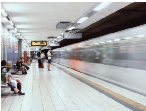
Öffentlicher Personennahverkehr muss gestärkt werden

Die 18. Legislaturperiode war durch einen Investitionshochlauf bei den Verkehrsinfrastrukturen des Bundes geprägt. Dafür stehen z. B. das Brückenprogramm für Autobahnen und Schienenwege. Die Gemeindeverkehrsfinanzierung dagegen haben Bund und Länder im Rahmen der Finanzverfassungsreform 2017 zwar künftig aufgeteilt, aber nicht – wie vom Deutschen Städtetag gefordert – bedarfsgerecht erhöht. Mit der Koalitions-