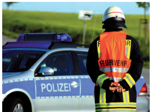
Gewalt gegen Einsatzkräfte und Stadtbeschäftigte erfordert Gegenmaßnahmen

Die Fachgremien haben sich im Berichtszeitraum regelmäßig mit der Problematik auseinandergesetzt. In mehreren Städten und Gemeinden hat es in der jüngeren Vergangenheit ernstzunehmende Vorfälle gegeben. In den Fällen, die bis zur Anzeige gelangen, handelt es sich meist um Beleidigungen und Bedrohungen, zum Teil sexistischen oder rassistischen Inhalts, Sachbeschädigungen, Schläge und andere körperliche Attacken kommen jedoch auch vor. Körperliche Angriffe, aber auch Bedrohungen und Beleidigungen führen nicht selten zu erheblichen seelischen und psychischen Belastungen der Mitarbeiterinnen und Mitarbeiter in den Verwaltungen mit der Konsequenz eines deutlich erhöhten Krankenstandes. Die aus der umfassenden Fürsorgepflicht des öffentlichen Arbeitgebers resultierenden Gegenmaßnahmen können im Einzelfall durchaus aufwendig sein und beträchtliche zusätzliche Kosten auslösen.