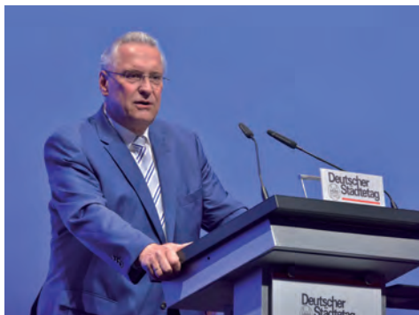
Rede von Joachim Herrmann, Staatsminister des Innern, für Sport und Integration des Freistaates Bayern am 1. Juni 2017

Der Staatsminister des Innern, für Sport und Integration des Freistaates Bayern, Joachim Herrmann, sagte zu Beginn seiner Rede, er erinnere sich an seine Erfahrungen als ehemaliges Stadtratsmitglied und fühle sich noch als Teil der kommunalen Familie in der Region. „Ich bin mit Begeisterung Kommunalminister und deshalb sage ich bei jeder Gelegenheit: Ein starkes Bayern braucht starke Kommunen, deshalb haben wir auch einen Anspruch der Gemeinden auf eine angemessene Finanzausstattung in die Bayerische Verfassung aufgenommen.“ Als wichtige Themen der neuen Bundesregierung in Zusammenarbeit mit den Ländern nannte er Investitionen in die Verkehrsinfrastruktur und sprach konkret das Gemeindeverkehrsfinanzierungsgesetz (GVFG) an. „Es ist unübersehbar, wir müssen den GVFG-Topf insgesamt in der nächsten Legislaturperiode deutlich anheben, weil wir anders sonst diese großen Verkehrsinfrastrukturprojekte in den Kommunen nicht geschultert bekommen.“ Herrmann schloss mit einem Appell, den es einzulösen gelte: „Deutschland braucht starke Städte.“