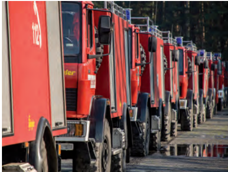
Berufsfeuerwehren brauchen geeigneten Nachwuchs

Zur Information, Gewinnung und Auswahl geeigneter Bewerber für die Berufsfeuerwehren der Mitgliedsstädte, insbesondere im höheren feuerwehrtechnischen Dienst, hat die Hauptgeschäftsstelle zum 1. April 2017 die Informations- und Beratungsstelle für die Ausbildung bei der Berufsfeuerwehr (IBS-Feu) eingerichtet. Aufgabe der IBS-Feu ist es zum einen, Interessentinnen und Interessenten über die Anforderungen und Möglichkeiten einer Ausbildung bei den Feuerwehren der Mitgliedsstädte des Deutschen Städtetages im höheren feuerwehrtechnischen Dienst zu informieren und auf Wunsch eine Leistungsmessung für Bewerbungsverfahren durchzuführen. Zugleich können Mitgliedsstädte bei der Durchführung von Auswahlverfahren zur Einstellung von Laufbahnbewerbern bei der Feuerwehr, insbesondere für den höheren feuerwehrtechnischen Dienst, beraten werden.