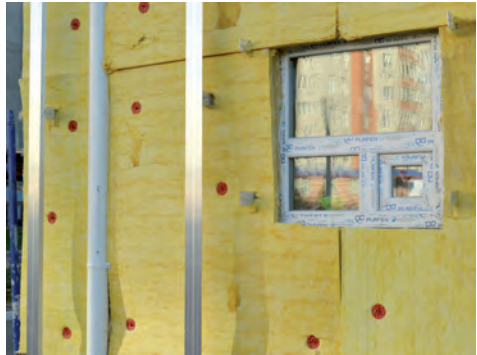
Fassadendämmung kann Energiebilanz von Gebäuden verbessern

des Ordnungsrechts mit der Zusammenführung von EnEG, EnEV und EEWärmeG. Der Deutsche Städtetag hat den Prozess der Erarbeitung des Gesetzesentwurfs eng begleitet, um kommunale Anliegen, die im Dezember 2016 vom Hauptausschuss beschlossen worden sind, frühzeitig einzubringen. Dies gilt beispielsweise für einen Quartiersansatz und eine bessere Einbeziehung effizienter Wärmeversorgungsstrukturen. Das Gebäudeenergiegesetz soll nach derzeitigem Stand im Zusammenhang mit dem Klimaschutzgesetz im Frühjahr 2019 vorgelegt werden.