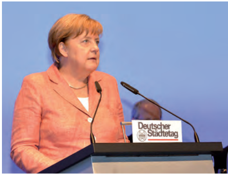
Rede von Bundeskanzlerin Dr. Angela Merkel am 31. Mai 2017

„Es ist sehr wichtig, dass wir im Gespräch bleiben.“ Mit diesen Worten begann Bundeskanzlerin Dr. Angela Merkel ihre Rede zu den Delegierten der Hauptversammlung und verwies auf die regelmäßigen Gespräche mit den kommunalen Spitzenverbänden im Zusammenhang mit dem Flüchtlingszug. Mit Blick auf die kommende Legislaturperiode sprach sie die Themen Bürgerportale und Digitalisierung an. Ziel sei es, dass die Bürgerinnen und Bürger einen einheitlichen Zugang zu allen staatlichen Leistungen haben. Das sei nicht nur eine finanzielle Herausforderung, deshalb müssten alle Akteure offen und intensiv an das Thema herangehen. Angesichts der Neuordnung der Bund-Länder-Finzen forderte sie, dass die Finanzbeziehungen transparenter gestaltet werden müssten. „Wir haben die Bund-Länder-Finanzbeziehung neu geordnet. Das war ein Kraftakt, um es mal ganz vorsichtig zu sagen. Die Einigung der Länder war möglich, weil der Bund mehr Verantwortung übernommen hat. Das haben wir gerne getan. Aber ich sage auch, wir tun es nur gerne, wenn zum Schluss auch irgendwas von den Bundesmitteln bei den Kommunen ankommt.“