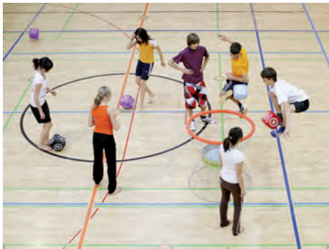
Schulsport soll wieder wichtiger werden

Zu den besonderen Herausforderungen des Schulsports zählen zunehmender Bewegungsmangel und immer mehr übergewichtige Kinder, die Dominanz kognitiven Lernens, mangelnde Schwimmfähigkeit und erhebliche Integrationsaufgaben. Zudem führt der Sportlehrermangel zu einem hohen Anteil fachfremd erteilten Sportunterrichts und zu einem im Vergleich zu anderen Fächern überdurchschnittlichen Unterrichtsausfall im Fach Sport.