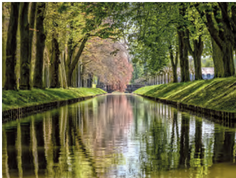
Spurenstoffe in Gewässern sollen reduziert werden

Der Dialog der Bundesregierung mit Kommunen, Wasserwirtschaft, Industrie und Landwirtschaft zum Eintrag von Spurenstoffen in Gewässer wird auch in der neuen Legislaturperiode fortgesetzt. Der Spurenstoffdialog geht der Frage nach, wie der Eintrag von Spurenstoffen in die Gewässer in Deutschland verringert werden kann. Die Empfehlungen aus dem Policy-Papier vom Juni 2017 werden derzeit in einer nächsten Runde des Stakeholderdialogs konkretisiert. Dieser Prozess läuft bis März 2019. Der Deutsche Städtetag ist mit zwei Vertretern in verschiedenen Unterarbeitsgruppen sowie der Plenarrunde vertreten. Aus Sicht der Geschäftsstelle ist es wichtig, dass Minderungsstrategien für Spurenstoffe zunächst „an der Quelle“ und beim Produkthanwender bzw. Produktnutzer ansetzen. Erst danach sind nachge-