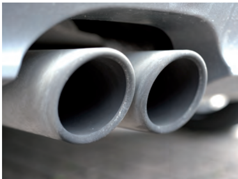
Anteil von Stickstoffdioxid (NO 2 ) in der Luft soll sinken