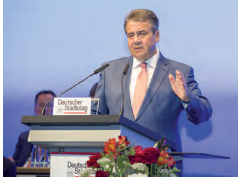
Rede von Bundesaußenminister Sigmar Gabriel am 1. Juni 2017

Der Bundesminister des Auswärtigen und Vizekanzler, Sigmar Gabriel, betonte in seiner Rede am Abschlusstag der Hauptversammlung, dass die Krisen in der Welt sich schnell auf kommunaler Ebene auswirken: „Wenn in Syrien Krieg herrscht, dann können wir nicht einfach weiterzappen, sondern am nächsten Tag sitzen die Flüchtlinge im ÖPNV neben uns“, so Gabriel. Mit Blick auf die Integrationsarbeit sagte er: „Wir stehen vor einer gesellschaftlichen und politischen Generationenaufgabe.“ Neben der Versorgung der Flüchtlinge mit Wohnungen, Schul- und Kitaplätzen und der Integration in Arbeit sei auch wichtig, die Präventionsarbeit auszubauen und Extremismus vorzubeugen.